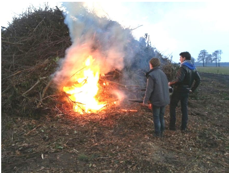
Paasvuur in' Hoonhook