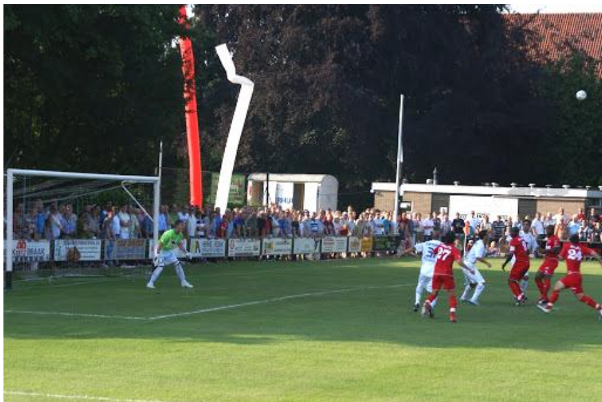
Nostalgie!!! Vier jaar geleden FC Twente-Gent op de Kruudnhof voor zo'n 3000 man publiek