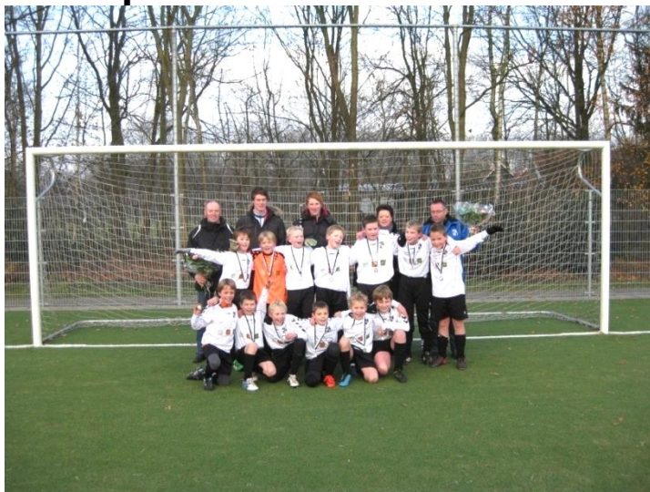
Na de ruime zege op ATC hier de trotse D2 formatie met begeleiders