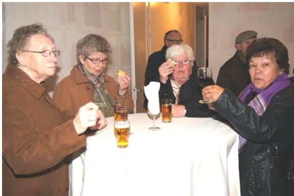
Nieuwe Beukenhof bewoners, deze dames genieten alvast