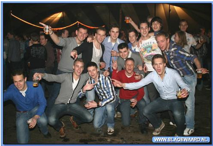
Indrukken van het zeer geslaagde Midwinterfeest in Beckum