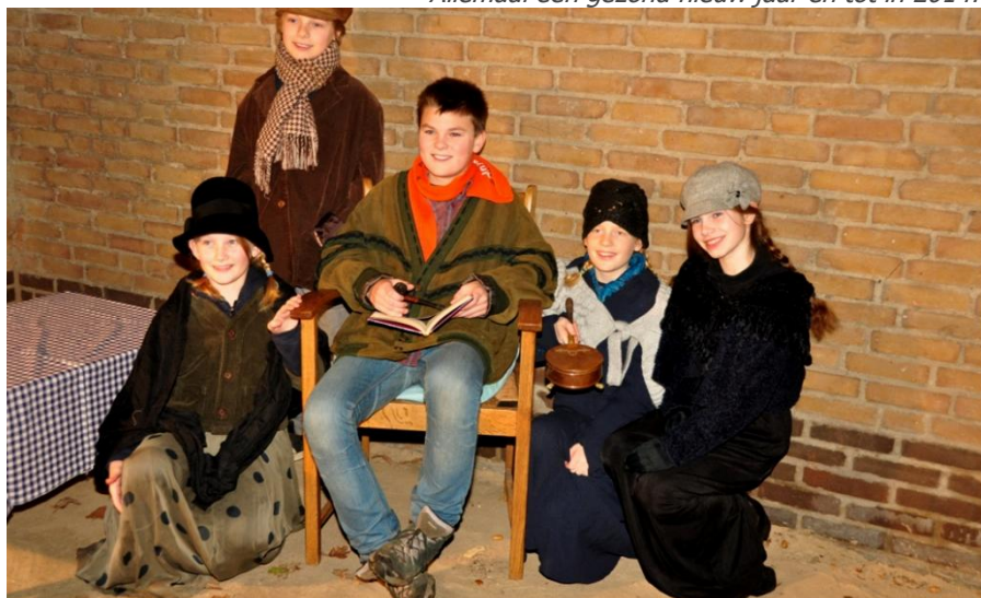
De kinderen met hun kerstverhaal en veel publiek bij de druk bezette kraampjes

Allemaal een gezond nieuw jaar en tot in 2014!