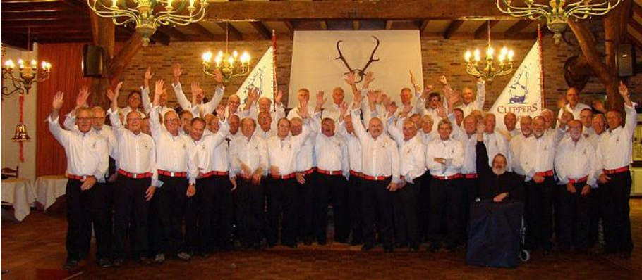
Het shantykoor Clippers Crew verzorgde een prachtig concert in de Beckumer kerk.