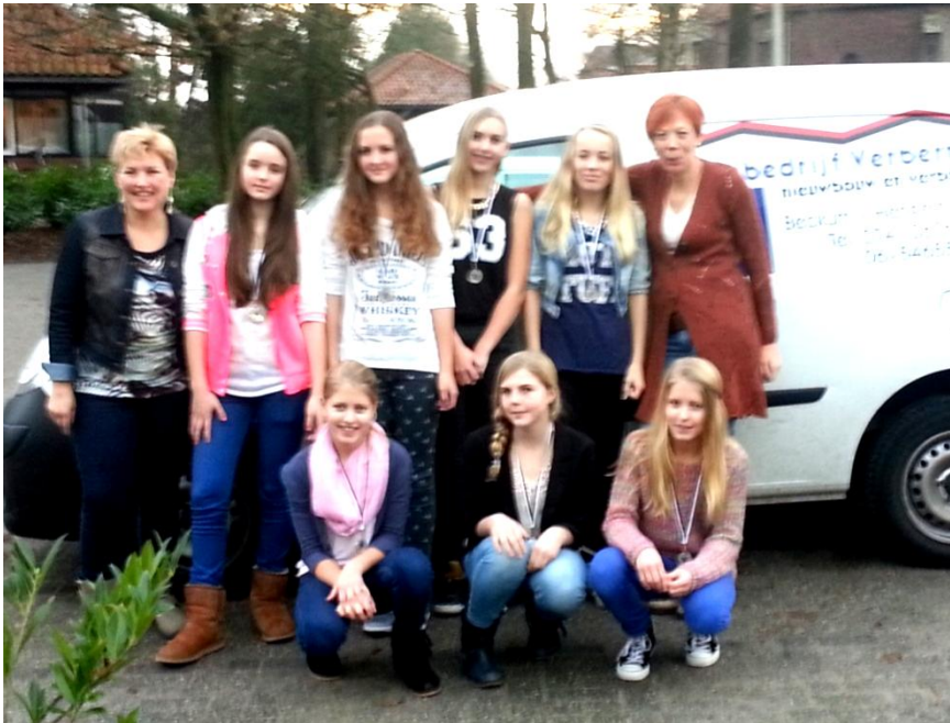
Meisjes van C1 volley met begeleiding; trotse kampioenen...