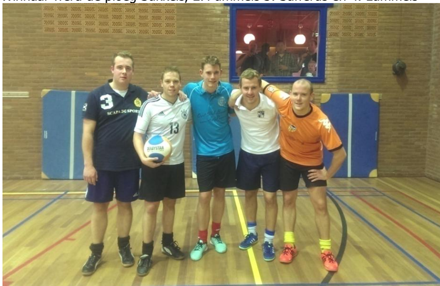
De voetvolleyspecialisten (met gastspelers?!); De Sukkels

Het voetvolleytoernooi voor de TVO voetbalsenioren was een zeer geslaagd evenement, waarbij bijna 50 deelnemers verdeeld over 10 ploegen, elkaar's krachten maten. Techniek, balbeheersing en slimheid waren de belangrijkste wapenen in dit spelletje. Dat ging sommige spelers goed af, maar kostte anderen de nodige moeite. Alom derhalve bewondering versus hilariteit in het veld en aan de zijlijn bij de toeschouwers.... Het opgestelde dartbord werd veelvuldig gebruikt in de pauzes (de dartkoorts was er ook in Beckum!) Winnaar werd de ploeg Sukkels, 2. Pummels 3. Sufferds en 4. Lummels