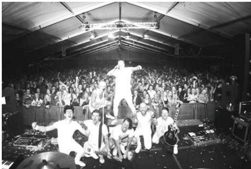
Sublieme show van de Dirty Daddies bij Midwinterfeesten Beckum