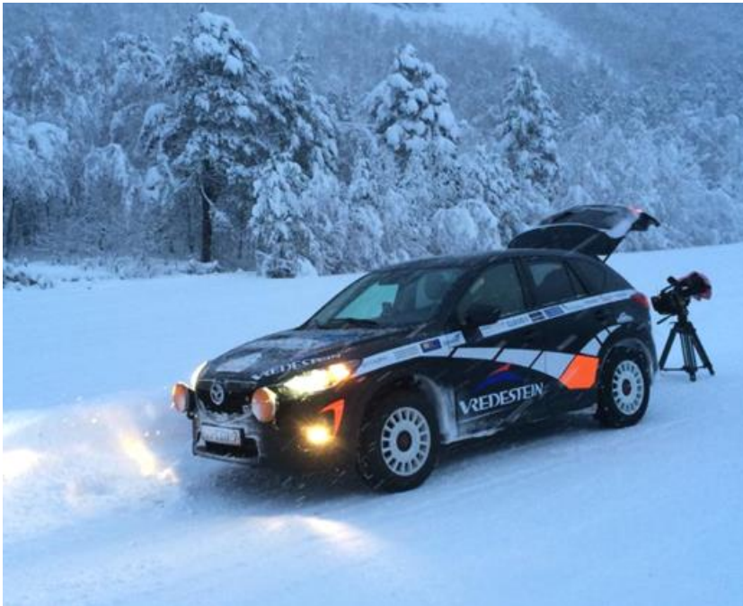
Scan Recovery Trial, team met Louis Ezendam naar Poolgebied en 11 januari veilig thuis

Ambtelijk en bestuurlijk werd samenwerking gezocht met Enschede en Haaksbergen en later ook Lossler. Er was ook een informatieavond en er werden werkgroepen opgericht. De provincie betaalt het vervolgonderzoek dat nodig is.