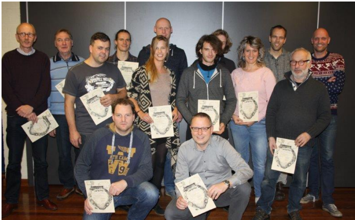
De geslaagden van 2014

De cursus bestaat uit een 3 theorie avonden en een 9 praktijkgedeelten en duurt ongeveer één bijenseizoen (maart t/m september). De theorie wordt gegeven in Isidorushoeve, de praktijk aan de Geurdsweg in Beckum.