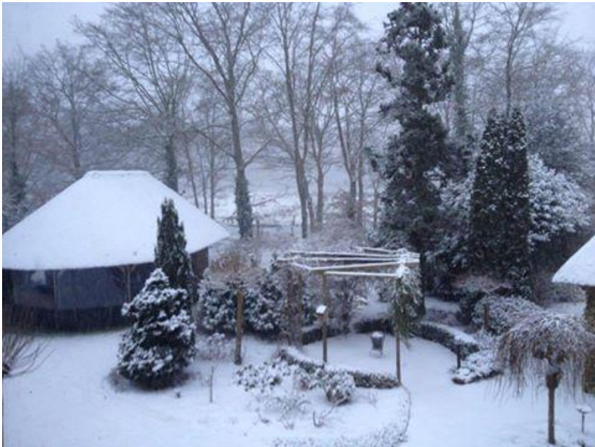
Zaterdag 24 januari; welkom voor één dag winter 2015! (foto Rita Temmink)

namens TVO voetbalbestuur, Alfons Harink