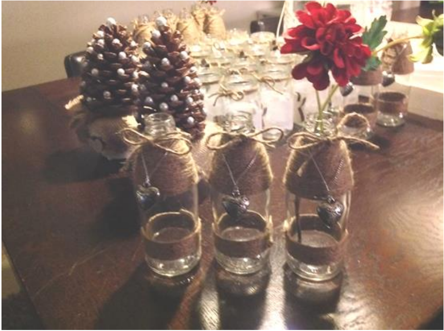
Prachtige kerstkunststukken waren vervaardigd en zijn verkocht