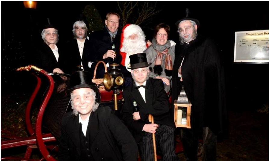
Deze Scrooges hebben de groepen 1 t/m 6 van basisschool De Bleek begeleid en hun tijdens de kerstwandeling het verhaal verteld van Ebenezer Scrooge. Dit in samenwerking met groep 7 en 8