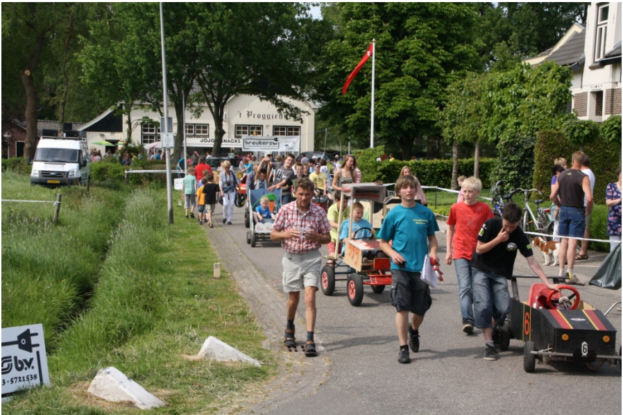
veel publiek en voldaan...