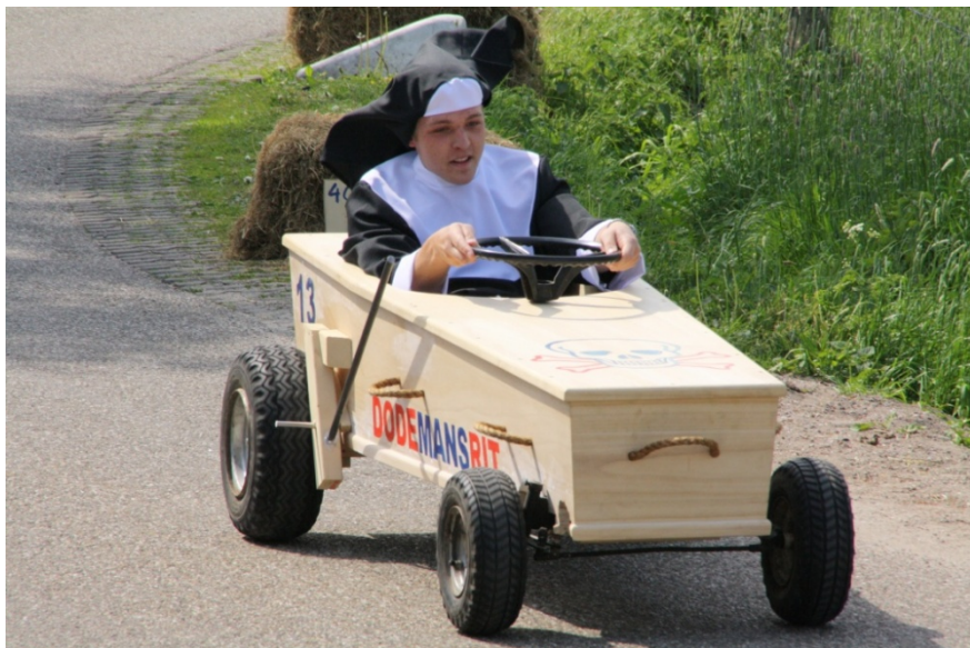
Luguber maar snel...