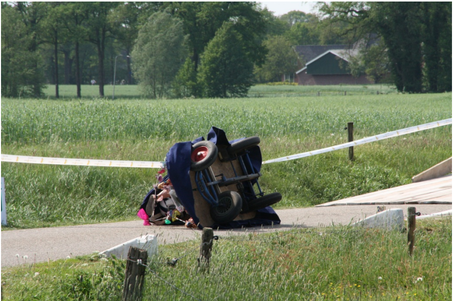
En ook pech onderweg...