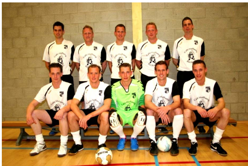
Kampioen in debuutjaar zaalvoetballen