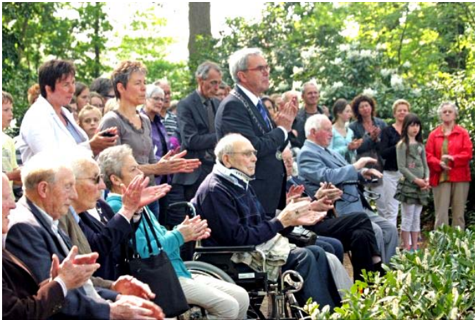
Indrukken van de waardige, druk bezochte herdenking