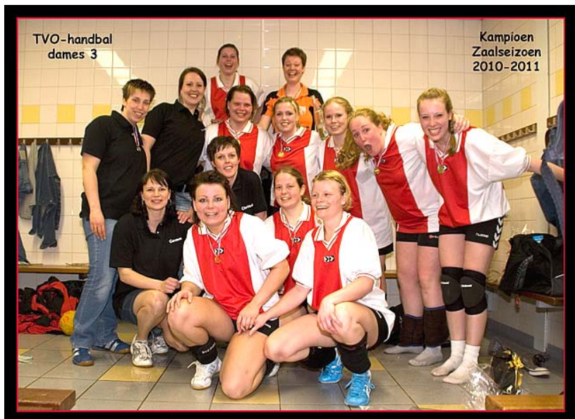
TVO Handbaldames3 kampioen