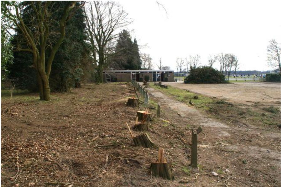
Oude dennen langs handbalveld gerooid; niets staat de bouw van de Beukenhof meer in de weg!