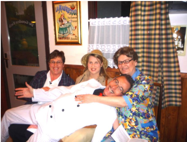
Een scene uit Wat is vrömd, komend weekend nog 2 uitvoeringen!