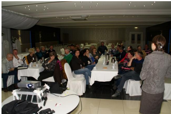
Druk bezochte presentatie bij Beckum Palace