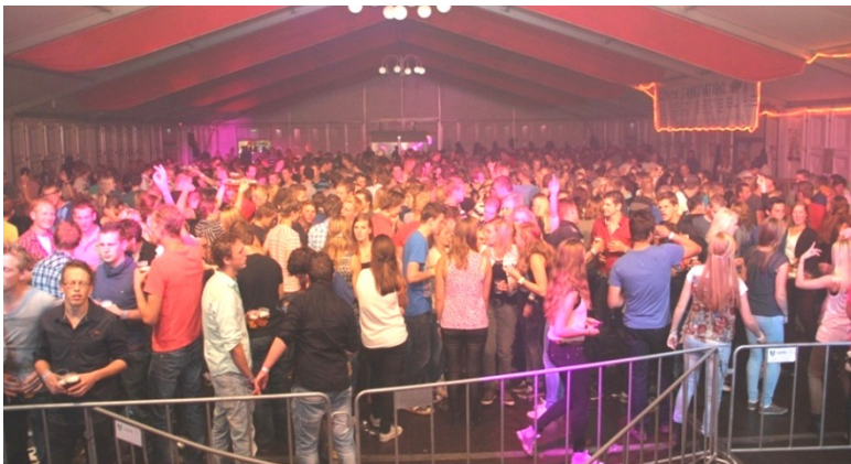
Tof feest op zaterdagavond in de volle Volle Polle-tent!