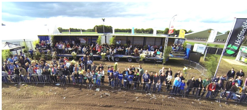
Vriendenlounge was goed bezet