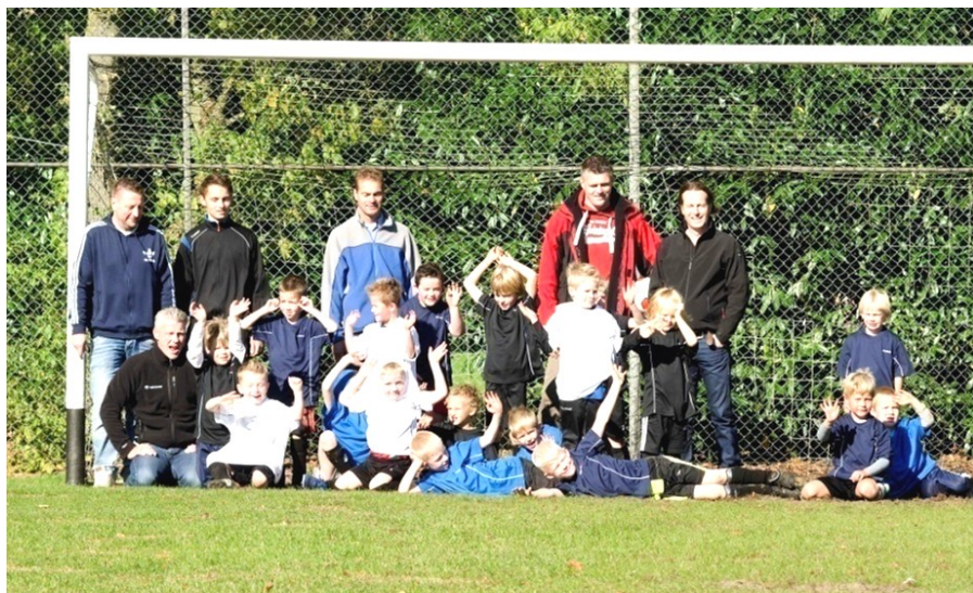
De vaders-leiders met alle enthousiaste spelertjes