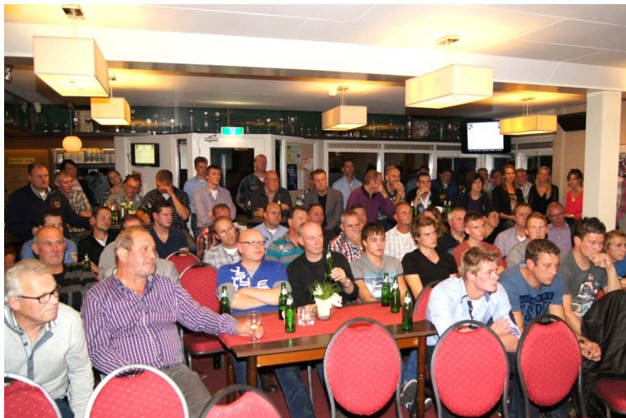
Een volle kantine genoot aandachtig van gastsprekers op de sponsoravond van de sv. TVO