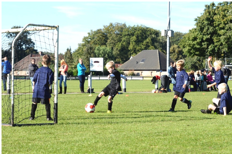
Volle inzet met vallen, opstaan en schieten van de pupillen