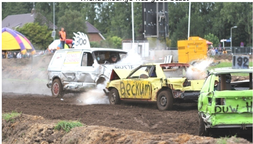
Volle actie bij Volle Polle