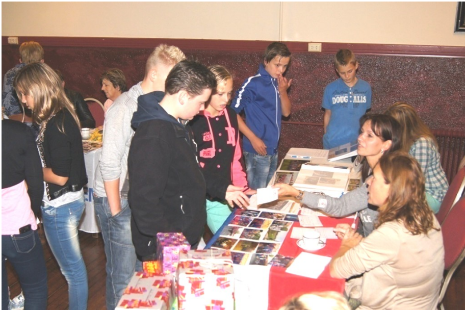
De druk bezochte vrijwilligersmarkt in het Proggiehoes