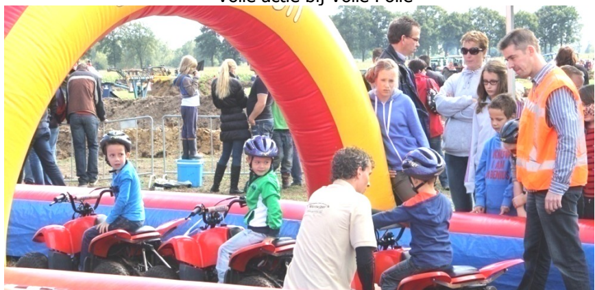
Het kinderparadijs met vermaak voor de jeugd