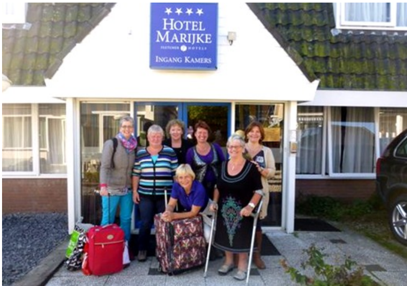
De dames goedgemutst voor het hotel