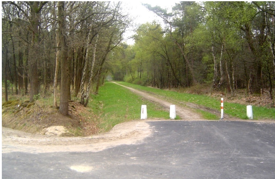
Boom-zien-rit... Van asfalt naar groen