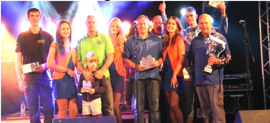
De autorodeo-winnaars in de schijnwerpers