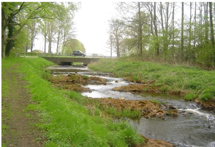
De Hagmolenbeek - in oude staat – onder de Haaksbergerstraat door