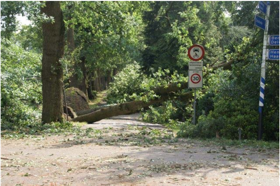
De storm hield ook in/rond Beckum hevig huis (lees ook Dag vd Wraak!)