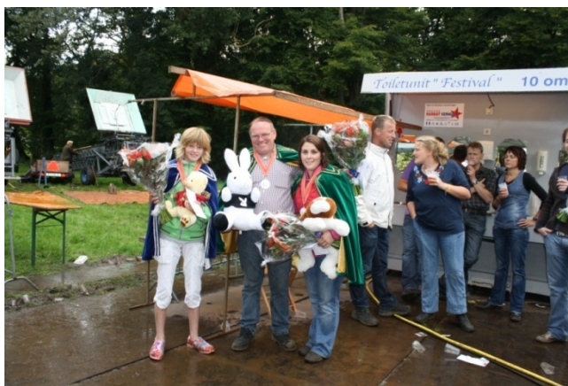
Winnaars vogelschieten Volksfeesten Oele