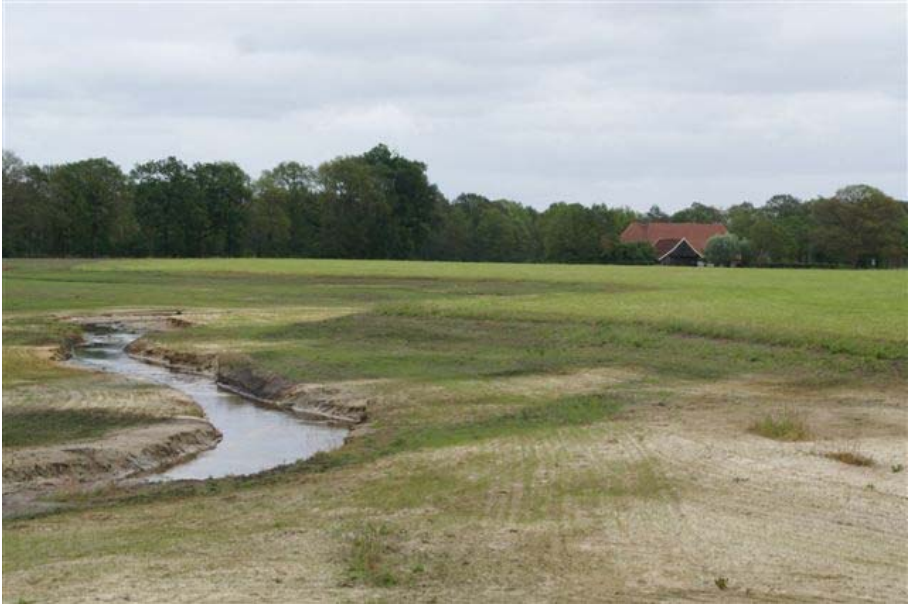
De gecorrigeerde Hagmolenbeek; voor en na de 'watervloed' eind augustus