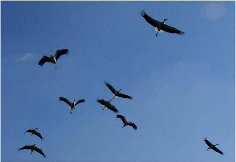
Heuse ooievaars gesignaleerd in' Hoonhook!