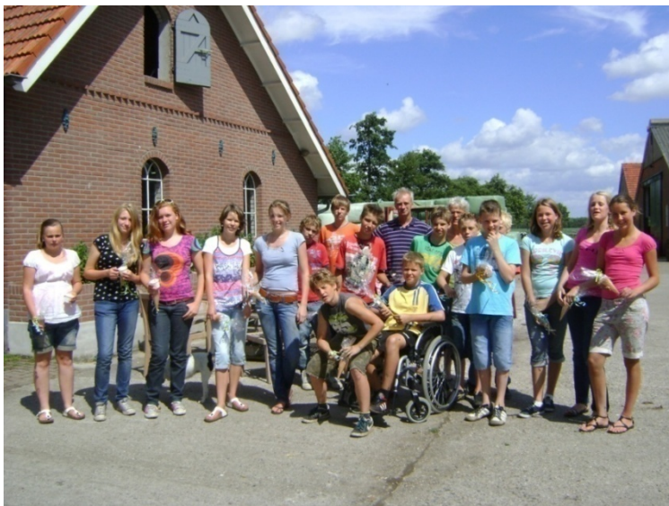
Vrijwillige jongeren; vele handen maakten licht werk!

* Op 22 september start het nieuwe seizoen van Werkgroep Jeugd met een casinoavond.