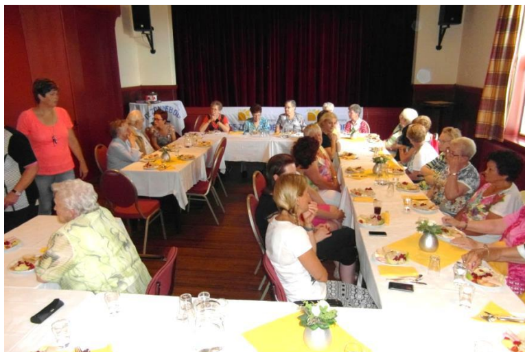
Genieten met de Zonnebloem in het Proggiehoes