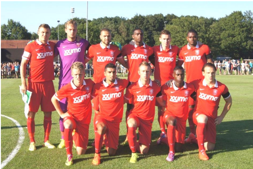
FC Twente op de BeckumerKruudnhof tegen Konyaspor voor 1700 toeschouwers