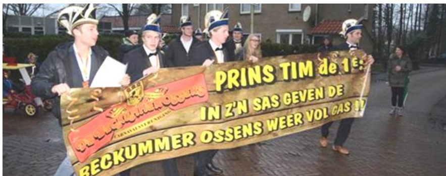
Carnaval voor Beckumer schooljeugd. Na de optocht viert de mooi verklede kinderparade met ouders en BeckummerOssens feest in de sportzaal met muziek en polonaises.