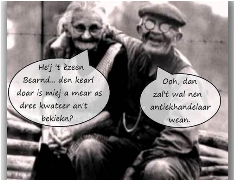
Weer zo'n mooie dreuge dialoog...