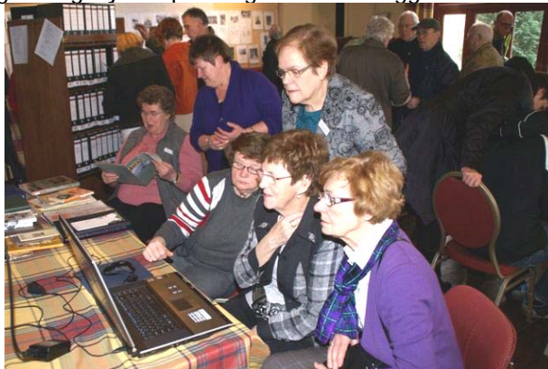
De diaserie op de labtop werd massaal bekeken

Grote belangstelling bij de open dagen in het Proggiehoes