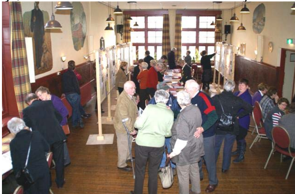
Honderden bekeken de vele kostbare, historische stukken